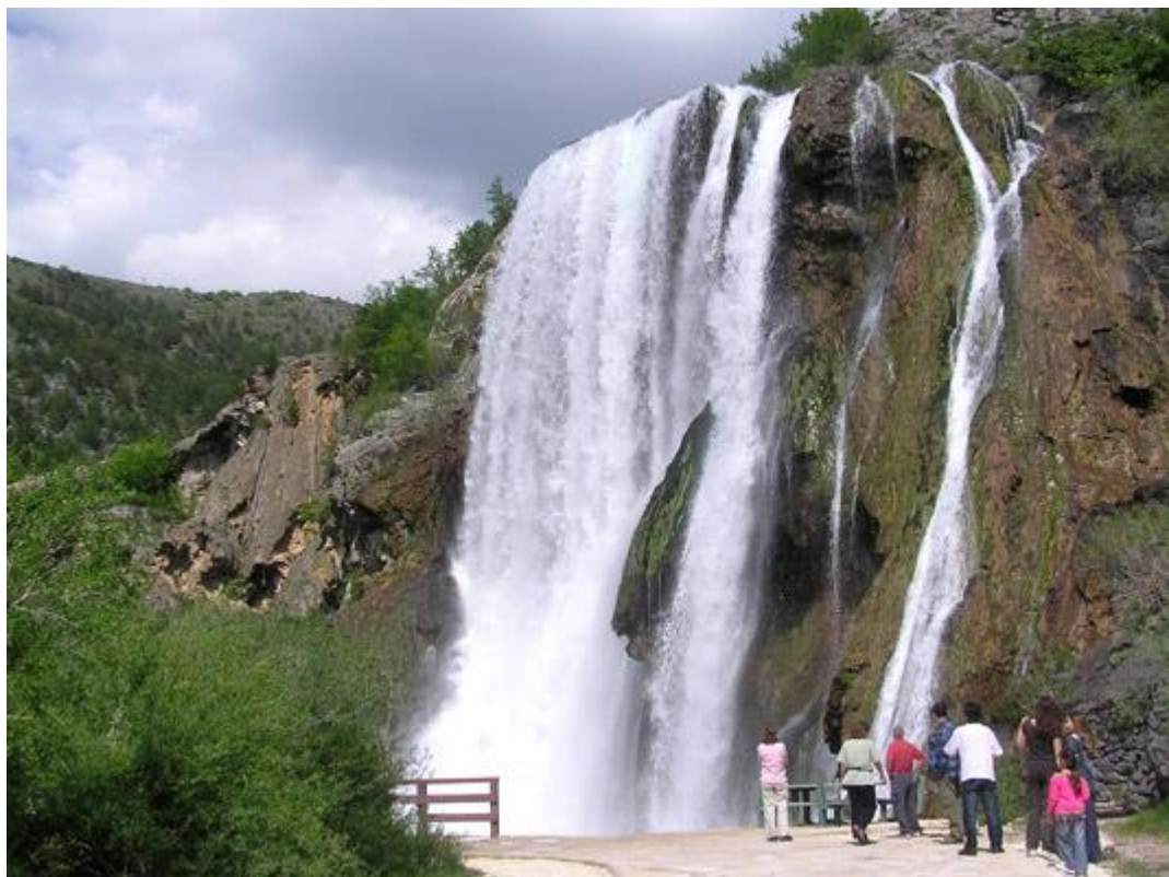
Slap Krčić ili Topoljski buk