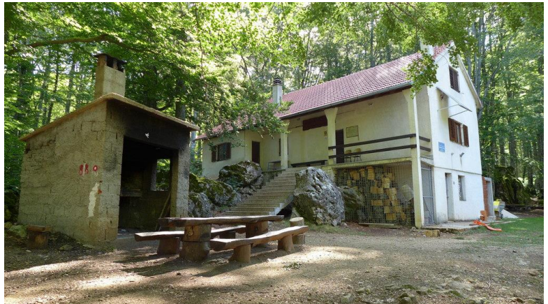
planinarska kuća na Brezovcu