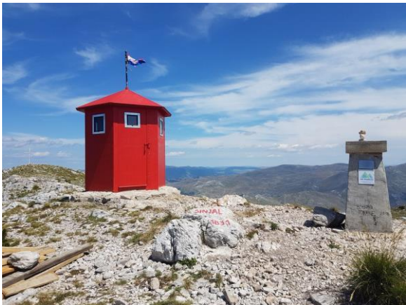
vrh Dinare - Sinjal

Po dolasku u kraljevski grad, obilazak KNINSKE TVRĐAVE, jedne od najvećih fortifikacijskih građevina u Dalmaciji. Izvorna utvrda je iz X. stoljeća, a kasnije je proširena do 480 m dužine i 110 m širine. Tvrđava je bila povremeno sjedište hrvatskih kraljeva i stalno sjedište kralja Dmitra Zvonimira. Pokretni mostovi dijele tri glavna dijela Tvrđave: gornji, srednji i donji grad. Sa sjeverne strane je veliki prokop koji dijeli Tvrđavu od brda Spas. Bunari, mračni hodnici, tajni prolazi, gorostasne zidine i crkva svete Barbare lako prenose posjetitelje u svijet srednjovjekovlja.