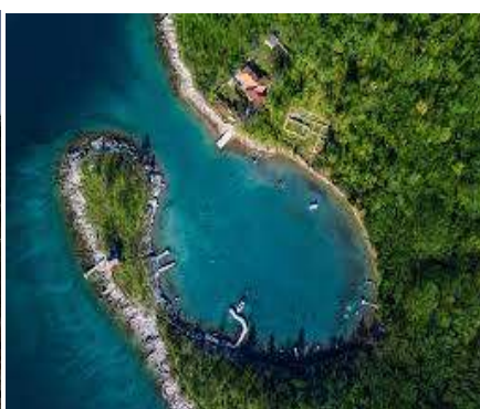
Detalj sa Staze valova