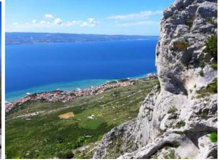
pogled sa Stomorice na Duće