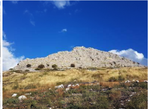
Sv. Jure na Perunskom