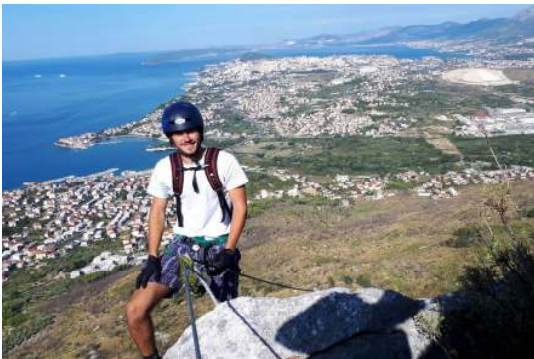
Via ferrata Perunika