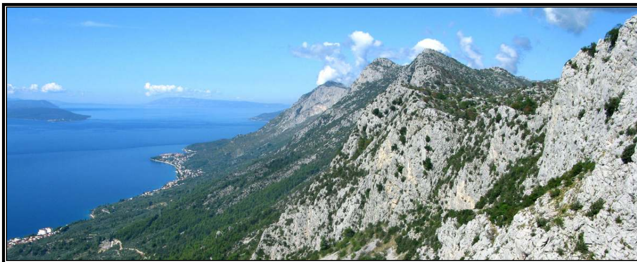
Rilić - pogled sa Sv. Ilije na Biokovo

nedjelja - subota, 27. rujna – 3. listopada 2020. godine