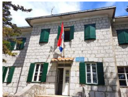
Mosor – dom „Umberto Girometta“