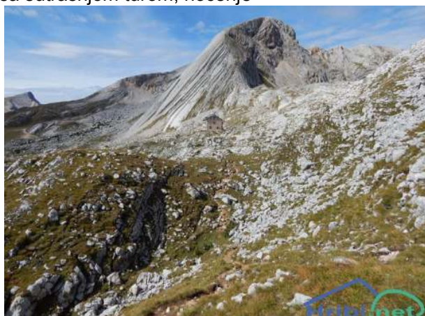
pl.kuća Rifugio Biella (Seekofelhütte) 2354m i Croda del Becco (Seekofel), 2810 m

6,00 sati: uspon iz pl.kuće Rifugio Biella (Seekofelhütte), 2354 m prema vrhu Croda del Becco (Seekofel, Sas dla Porta), 2810 m, markantnom vrhu skupine Sennes, visoko iznad jezera Lago di Braies (Pragser Wildsee) u dolini Val Pusteria (Pustertal), odmor na vrhu, silazak istim putem u Rifugio Biella, visinska razlika 456 m, 2,30 sati, ukupno hoda 4 sata, K1/T3 , upoznavanje polaznika sa sutrašnjom turom, noćenje