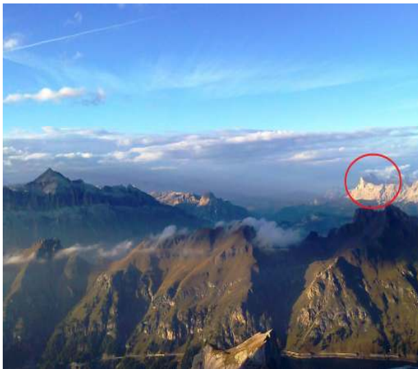
Desno Cima Dieci (Zehnerspitze, Sasso delle Dieci), 3028 m, u skupini Fanes-Sennes, lijevo Piz Boe (3152 m) najvi vrh skupine Sella, između dolina Val Badia, s Marmolade, "Kraljice Dolomita"

15.-20. srpnja 2018. (6 dana: od nedjelje do petka)