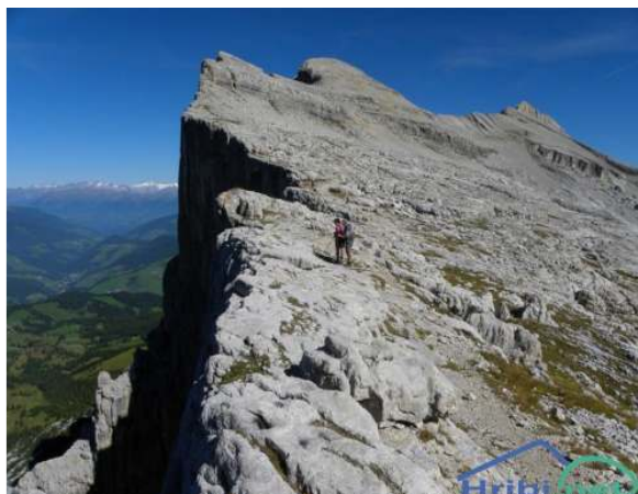
Cima Dieci (Zehnerspitze, Sasso delle Dieci), 3028 m, desno, u sredini Monte Cavallo (L'Ciaval, Kreuzkofel) 2907m, ispod kojeg je pl.kuća Rifugio la Crusc iznad Val Badie

6,00 sati polazak na cjelodnevnu kružnu turu (na turi nema pl.kuća): uspon od Rifugio la Crusc, 2045m-staza 7, klinčanim putem, via ferratom, "Heiligenkreuzkofel Kletterstieg" A/B preko jugozapadne stijene na prijevoj Passo di Santa Croce (Kreuzkofelscharte, Ju dla Cruce, 2612 m), kraškom visoravni do kratkog klinčanog puta, viae ferrate, "Zehnerspitzeklettersteig" prije vrha, Cima Dieci (Zehnerspitze, Sasso delle Dieci), 3028m, odmor, povratak istim putem do križanja staza 7 i dalje 12, via normale preko prijevoja Ju dla Medesc (Forcella Medesc), dalje stazom 15 u Rifugio la Crusc na noćenje, visinska razlika 983 m, ukupno hoda do 9 sati, K3/T3