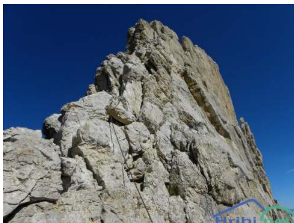
vrh Cime Dieci-kratki klinčani put (via ferrata, "Zehnerspitzeklettersteig")