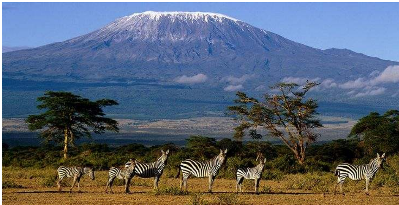
Kilimanjaro 5.895 m

nedjelja - utorak , 12.-28. kolovoz 2018. godine